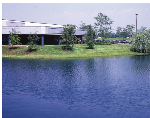
Avec True Blue