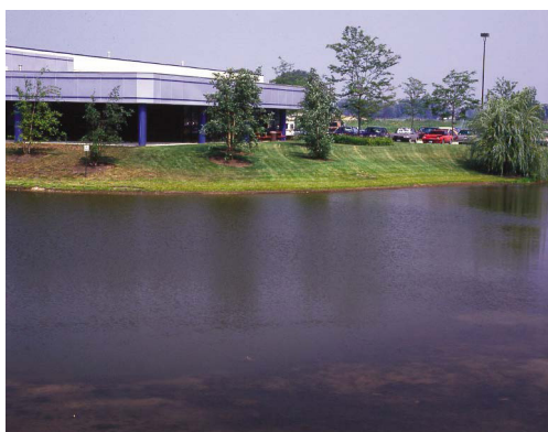
Sans True Blue

Les lacs et étangs sont plus beaux lorsqu'ils sont propres, clairs et naturellement agréables. La teinture True Blue pour lacs et étangs est un mélange exclusif de colorants solubles dans l'eau formulé pour réduire la pénétration du soleil et conférer une coloration bleue attrayante aux étangs naturels ou artificiels, aux obstacles aquatiques, aux lacs et aux fontaines. True Blue est sécuritaire et non toxique pour les poissons, les oiseaux et les animaux. Les True Blue EZ SoluPaks facilitent encore l'application, avec des sachets de dosage individuels prémesurés dans un emballage hydrosoluble pratique.